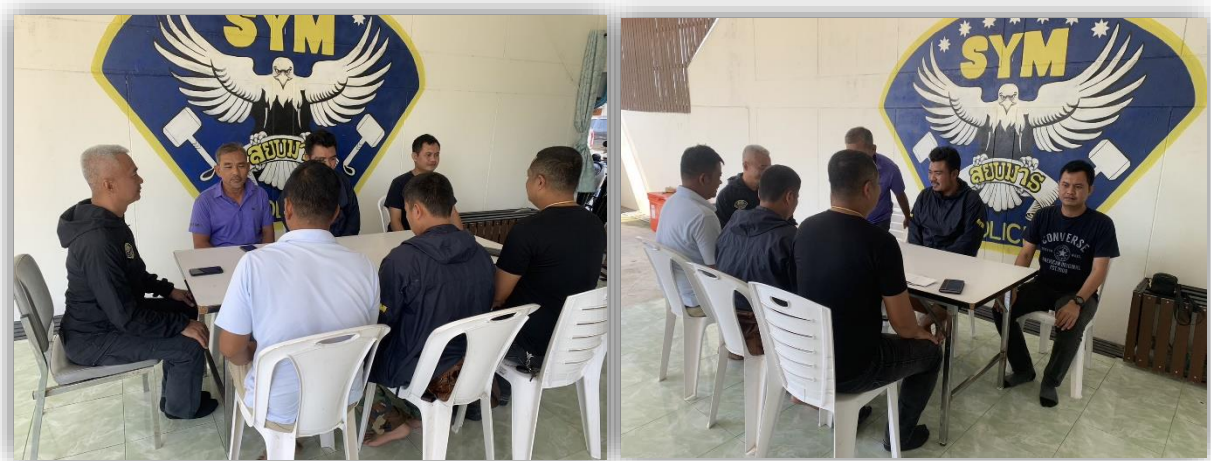
ภาพประกอบผลการดำเนินงาน