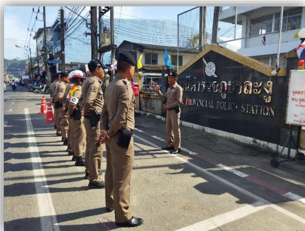
ภาพประกอบผลการดำเนินงาน