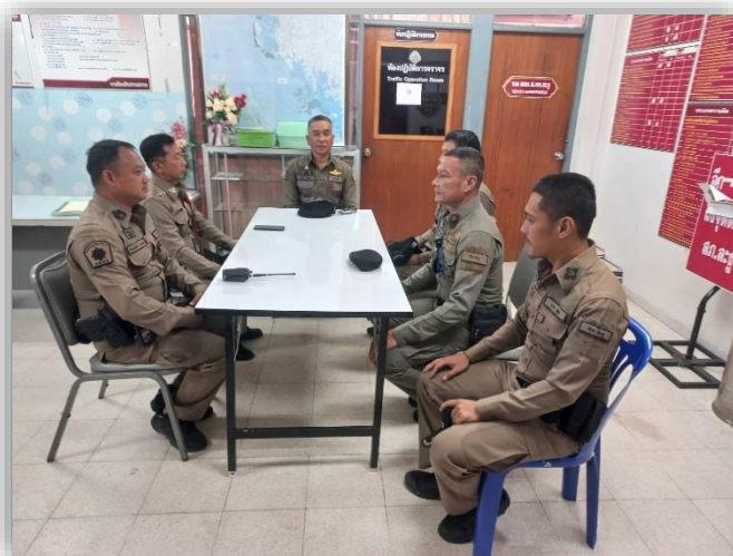
ภาพประกอบผลการดำเนินงาน